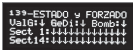
Pantalla 139: Pantalla de salidas: Válvula General, Generador Diesel, Bomba y Sectores de riego

En estas pantallas observamos el estado de las salidas: